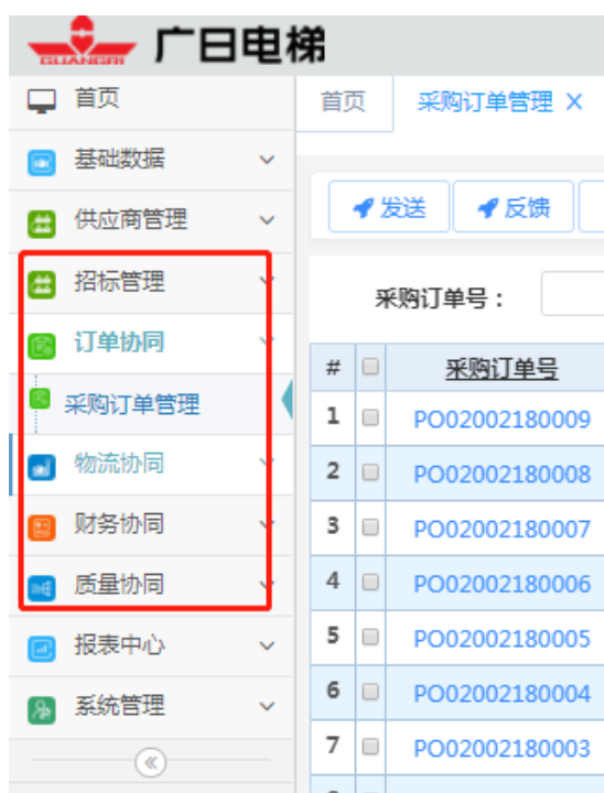
图 2 SRM 系统

广日电梯通过 SRM 信息化管理平台把招投标工作转变成线上，简化了工作准备环节，最大限度保证了业务公平性、效率性，并将相关订单处理也转至 SRM 系统，实现了供应商处理订单效率提升，降低劳动强度，从根本上实现公司快速响应的核心价值。此外，SRM 系统也可以对产品质量问题进行有效监控，及时传达与记录产品质量问题，加快了质量问题的处理速度，促进整个供应链质量水平优化与提升。