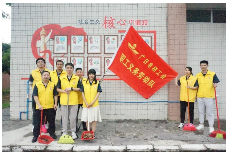
图 21 义务劳动现场图

2019 年 6 月，公司组织了多名志愿者到石楼岳溪村何澄溪小学进行义务劳动，在学校打扫卫生、整理图书，为师生营造了良好学习环境。