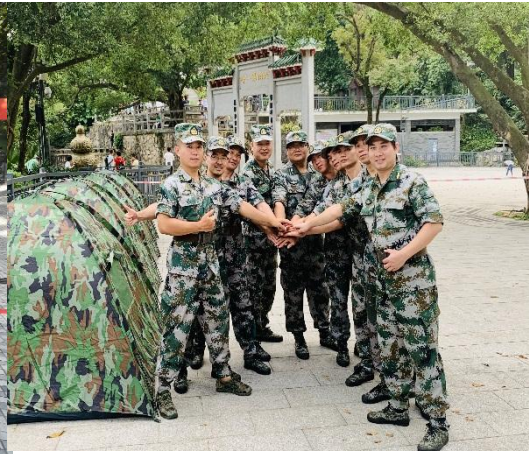
图 12 重阳节白云山防火执勤