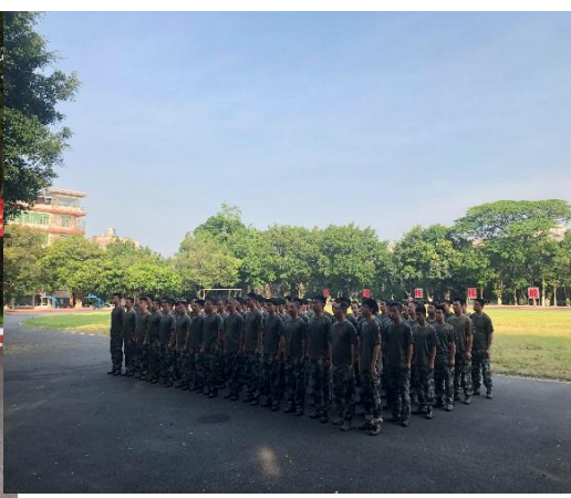
图10 学生军训动员大会