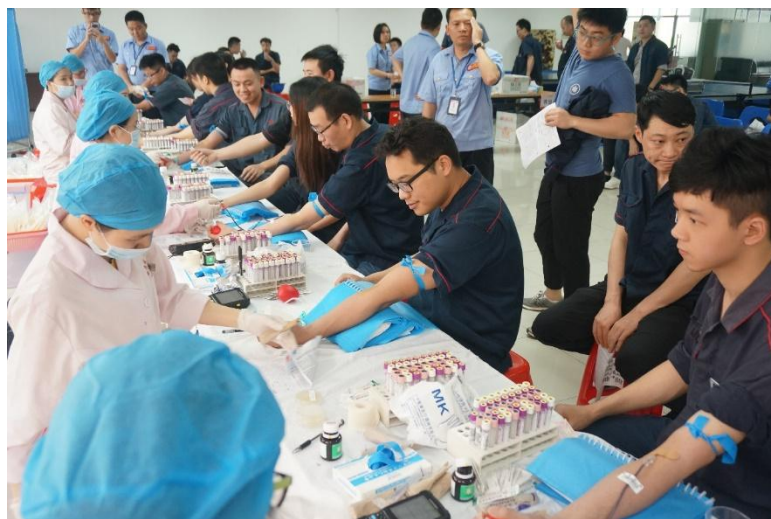
图 20 献血活动现场图

献血量达 1.6 万多毫升，为拯救生命献出了微薄之力，展示出广日人关爱他人、奉献社会的精神风貌。