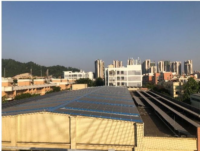
图 14 厂房屋顶并网型太阳能光伏发电工程一期（550KW）

公司智能装备制造产业积极响应国家号召，旗下松兴电气经申报获批准在现有厂房屋顶建设总规模 600KW 的并网型太阳能光伏发电工程。其中一期(550KW)工程于 2019 年 6 月底完工并实现并网发电，与 2018 年相比，2019 年节省电费 14 万元；60KW（二期）宿舍光伏工程将于 2020 年完成。企业屋顶安装光伏电站后实现太阳能、建筑的综合利用，不仅让企业达到节能减排的效果，也尽到了改善周边环境的社会责任。