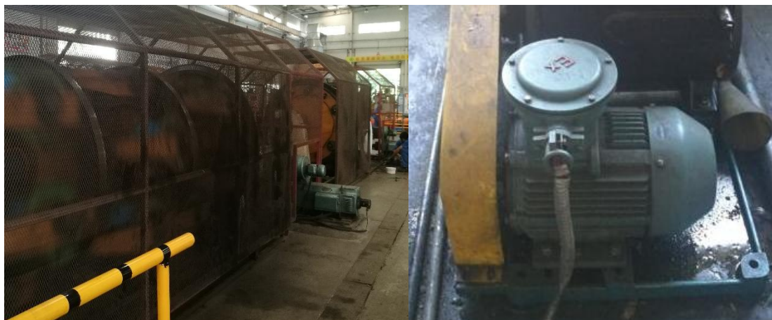
图 13 节能电机

并通过将荧光灯更换为 LED 照明灯，实现灯具升级每年节省用电约 3000 度；通过对制造部门不锈钢整体站厕改造减少因冲厕水长流造成水费（含污水处理费）浪费，每年可以节约用水 12672 m 3 。此外，广日电气对电线电缆生产设备主电机更换成节能电机，推进工业节能降耗，全面提升电机能效水平，节能等级提升 1 级。负荷率 75%，节电率 3%，每年节电约 8200 度。