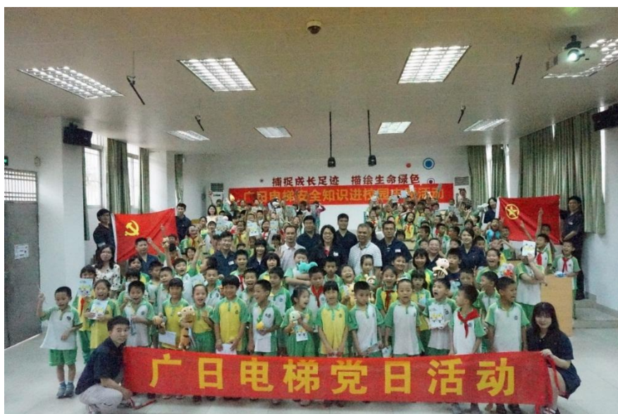
图 18 电梯安全知识进校园活动

为提高中小學生电梯安全知识，广日电梯组织近 20 名党员、工会干部和团员志愿者参加以“关爱生命，关注电梯安全”为主题的志愿者活动，活动为 130 名石楼镇何澄溪小学生开展了一次电梯安全知识进校园活动。让学生掌握安全乘坐电梯的知识，有效提高学生们的安全意识，也带动了家长和乃至整个社会提升安全意识，为构建安全和谐社会作出了贡献。