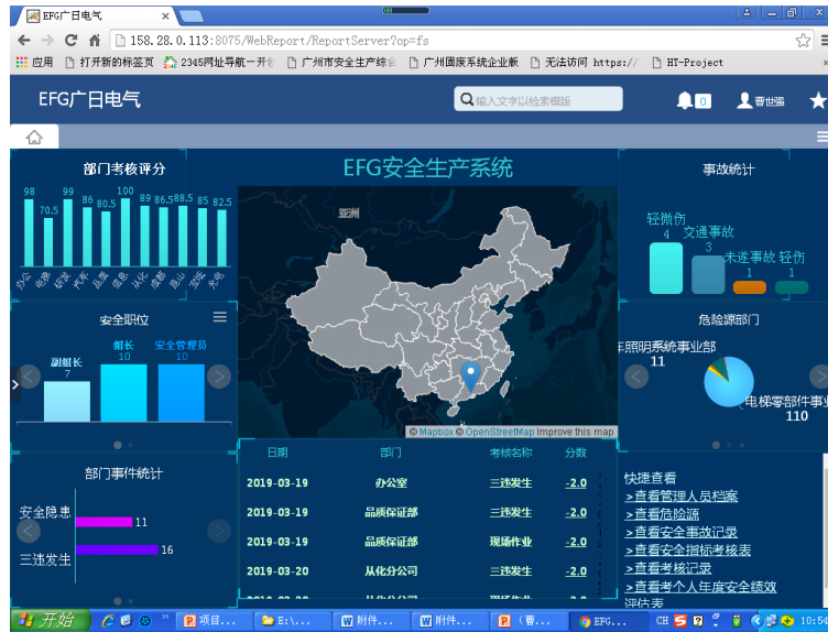
图 5 广日电气安全生产系统

产管理平台，所建安全管理数据库记录公司每一位员工过往的个人安全管理绩效表现，为公司决策层选拔人才提供重要参考依据，促进了公司的安全生管理水 平迈上新台阶，树立企业良好的社会和公众形象。