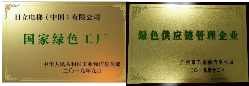
图 15 日立电梯荣誉证书