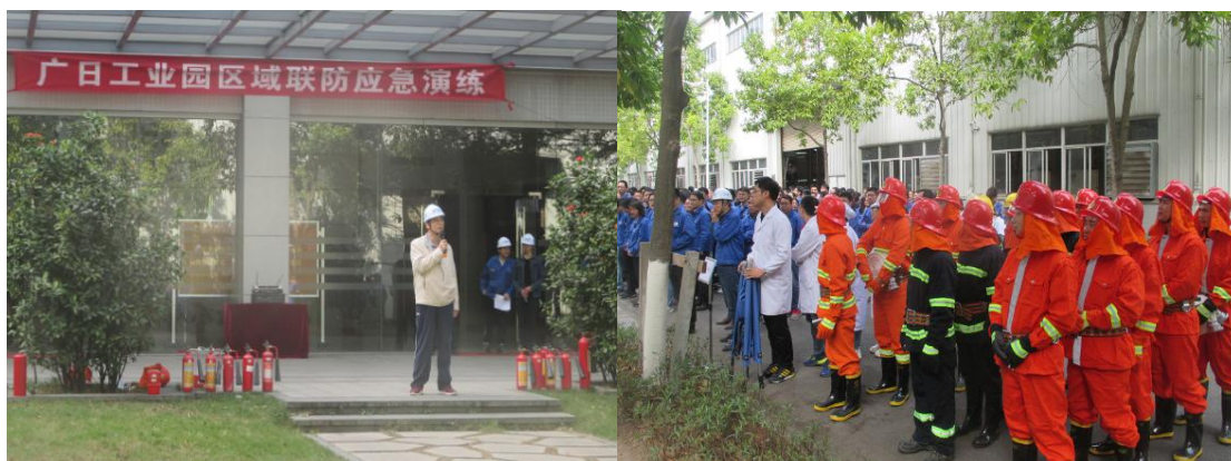
图8 广日工业园消防安全区域联防应急预案演练