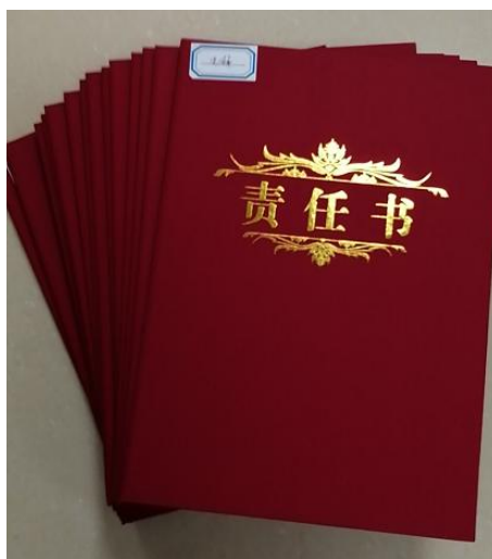
图 4 《二〇一九年度“五项工作”责任书》

公司与下属 12 家企业主要负责人签订了包含安全生产在内的《二〇一九年度“五项工作”责任书》切实落实安全生产责任制，督促各下属企业按要求抓好安全生产的层级责任落实工作，将安全生产责任层层分解落实到各级领导、各部门、各班组、各岗位人员，形成了“横向到边、纵向到底、责任到人、不留死角”的安全工作网络格局，本年度公司及下属企业签订的安全生产责任书共计 2389 份，合计 4543 人。