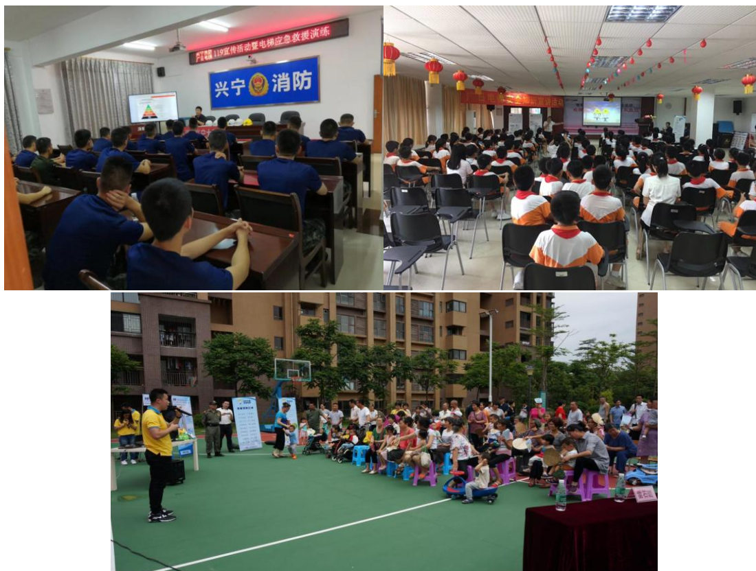
图 17 电梯安全宣传活动

为提高中小學生电梯安全知识，广日电梯组织近 20 名党员、工会干部和团员志愿者参加以“关爱生命，关注电梯安全”为主题的志愿者活动，活动为 130 名石楼镇何澄溪小学生开展了一次电梯安全知识进校园活动。让学生掌握安全乘坐电梯的知识，有效提高学生们的安全意识，也带动了家长和乃至整个社会提升安全意识，为构建安全和谐社会作出了贡献。