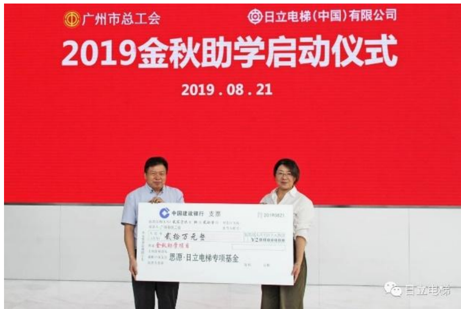
图 22 “金秋助学”捐赠仪式

得金额共计 147598.47 元。公司积极搭建企业社会责任社会化网络，通过“卫蓝侠”、“金秋助学”活动积累公益队伍 61 支、影响公益用户 4265 次。