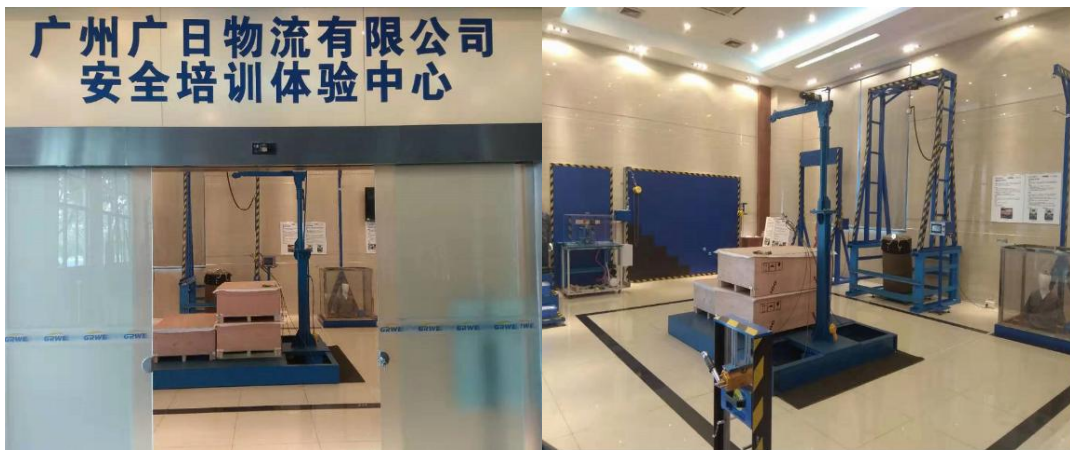
图 6 广日物流安全培训体验中心

广日物流创新安全宣教模式，建立安全培训体验中心，配备重物坠落试验、拉力体验装置、安全带试验、消防体验、模拟吊装体验装置等 11 项体验设施，投资超过 15 万元。通过模拟各种安全隐患场景，打破传统教育方式，对员工进行“体验式”培训。至今开展培训教育 30 场次，受培训人员超过 600 人次。