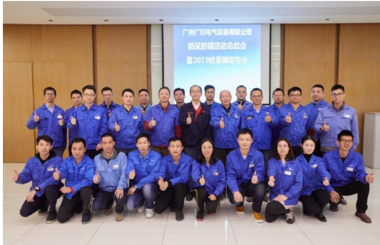
图 3 防呆防错总结暨拾落穗发布会

在现代服务业中，公司坚持“质量第一”的原则，对生产作业流程进行全过程质量监控，做到注重过程，严格筛选，严控质量。通过对标英国劳氏质量管理体系升级质量管理体系，加强质量过程监控及供应商指引，把控主要环节风险，促进公司质量管理向国际标准迈进。