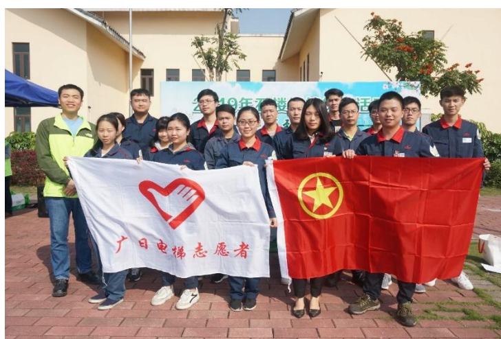
图 19 植树节活动现场图

2019年3月，公司组织多名志愿者参加由番禺区石楼镇团委组织的“植树节不仅3.12而是365”为主题的植树节活动，现场还开展了衣物回收、垃圾回收和健步行等环节，激发了员工绿化意识、环保意识。