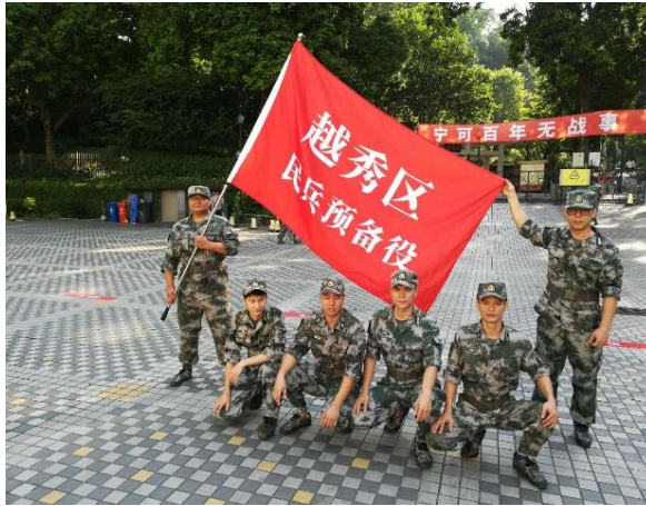
图 11 “羊城天盾-2019”人防演练