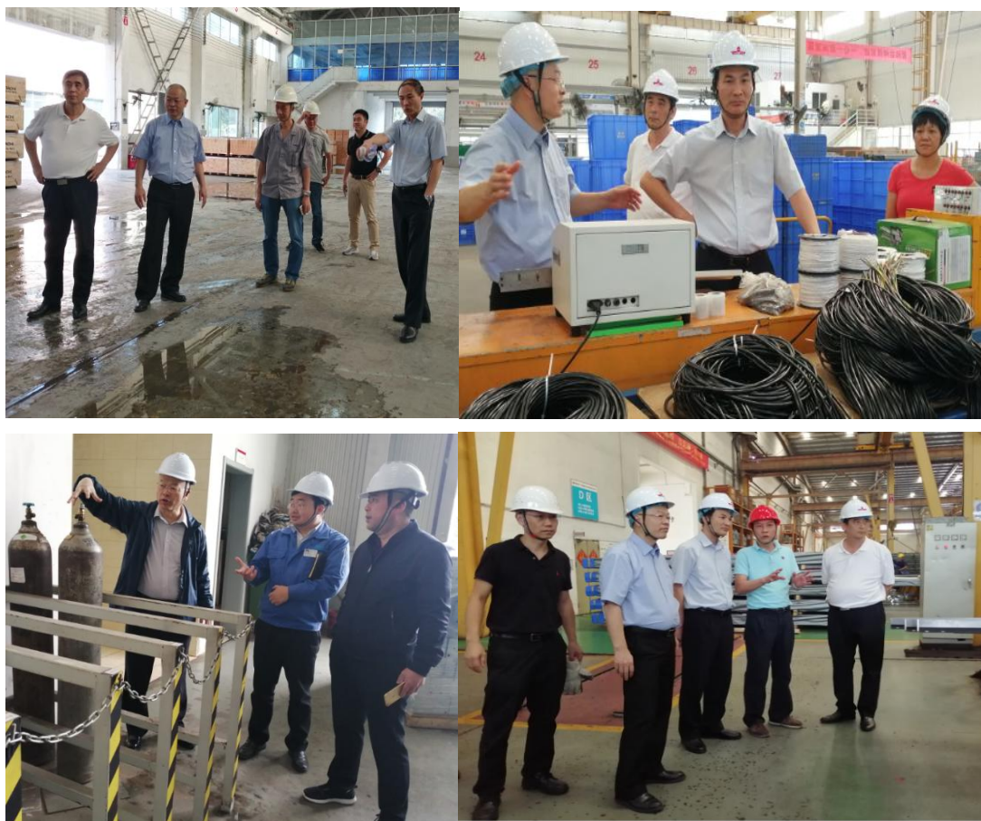
图 7 安全检查组定期不定期安全检查

210 余条，隐患整改回复率 100%，保证了企业员工的生命安全、有效降低了企业财产损失。